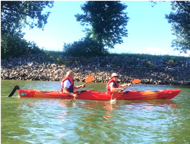
Neulinge und alte Hasen zwischen Worms und Hamm

Zum Feierabendpaddeln trafen sich dann einmal pro Woche die Paddler um kurze Kanutouren zu unternehmen. Beliebte Paddelstrecken sind von der Frankenthaler Nato-Rampe zum WSV Worms oder vom WSV nach Hamm. Die eine oder andere Tagestour wurde auch schon gefahren, z.B. rund um den Kühkopf auf dem Rhein und Erfelder Altwasser.