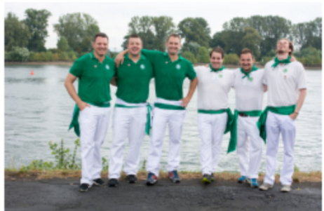
WSV 1. Und 2. Mannschaft