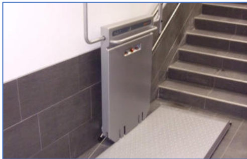
Beispiel des geplanten Treppenlifts

Damit zukünftig auch Mitglieder und Gäste des WSV mit mobilen Einschränkungen bis hin zum Rollstuhlgebrauch in unser hochgebautes Vereinsheim gelangen, bauen wir in den kommenden Wochen einen Plattformtreppenlift an der Treppe zu unserem Mehrzwecksaal ein.